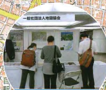
眺めて楽しい地図 地図協会

平成27年6月 入場無料! 3・4・5 10:00 ~ 19:00 (5日は17:00まで) 新宿駅西口広場イベントコーナー