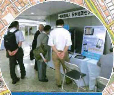
地図と空中写真のことなら 日本地図センター