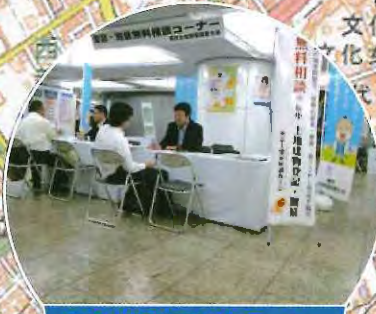
登記・測量無料相談コーナー 東京土地家屋調査士会