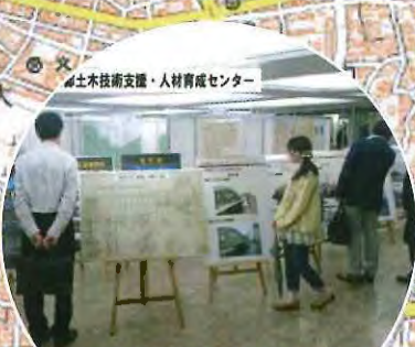
東京のまちづくりを支える 測量・土木技術をご紹介 東京都土木技術支援・人材育成センター