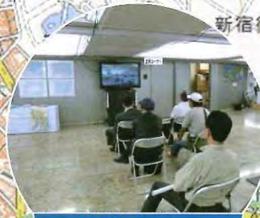
上映コーナー 国土地理院関東地方測量部

主催 「測量の日」東京地区実行委員会 共催 東京都 後援 新宿区 問い合わせ先 03(5213)2051