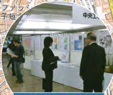
伝統ある実務教育 中央工学校