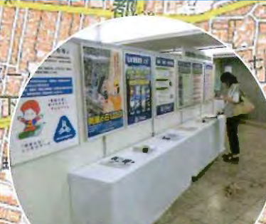
測量成果品の品質確保 日本測量協会関東支部