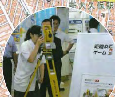
距離当てゲーム(景品付)もあるよ 東京都測量設計業協会