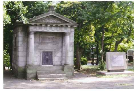
東京都千代田区永田町1-1(国会前庭北地区憲政記念館構内)

この石造りの建物の中には、国内の高さの測定の基準になる 日本水準原点 が設置されています。