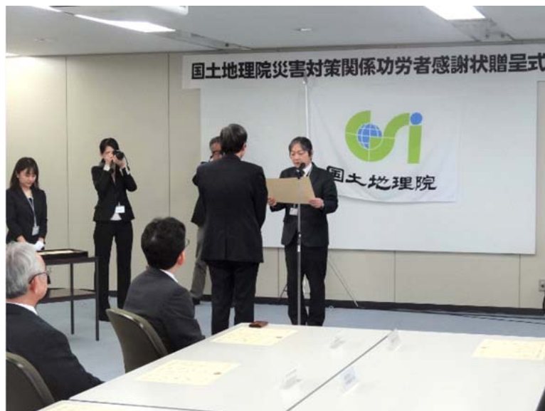
平成29年4月11日 授与式

国土地理院長より、熊本地震に関する災害対策活動の協力に対して、平成29年3月24日、当協会に感謝状が授与されました。