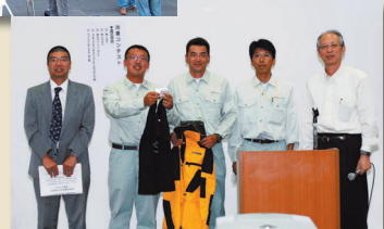
昨年の表彰式風景